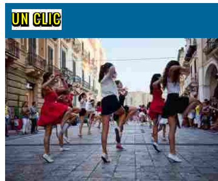
Milazzo, flash mob e balli spagnoli in via Medici